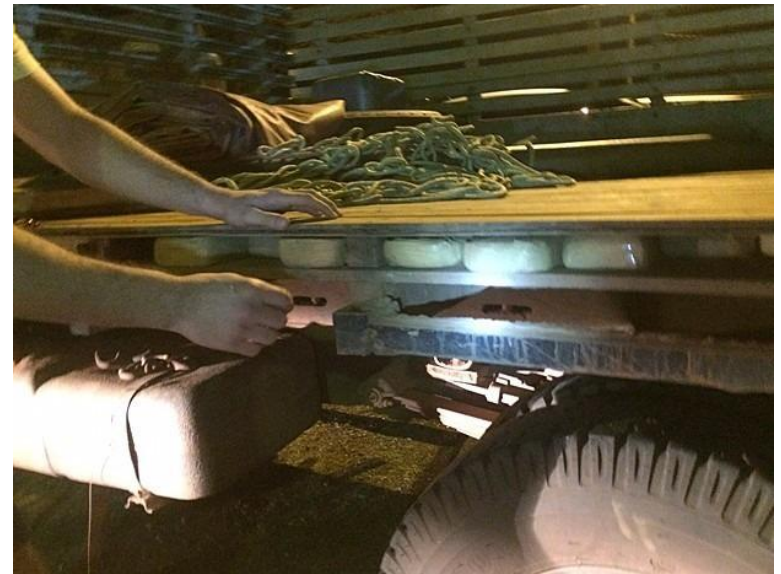
Operação Mosaico - 170 kg de cocaína